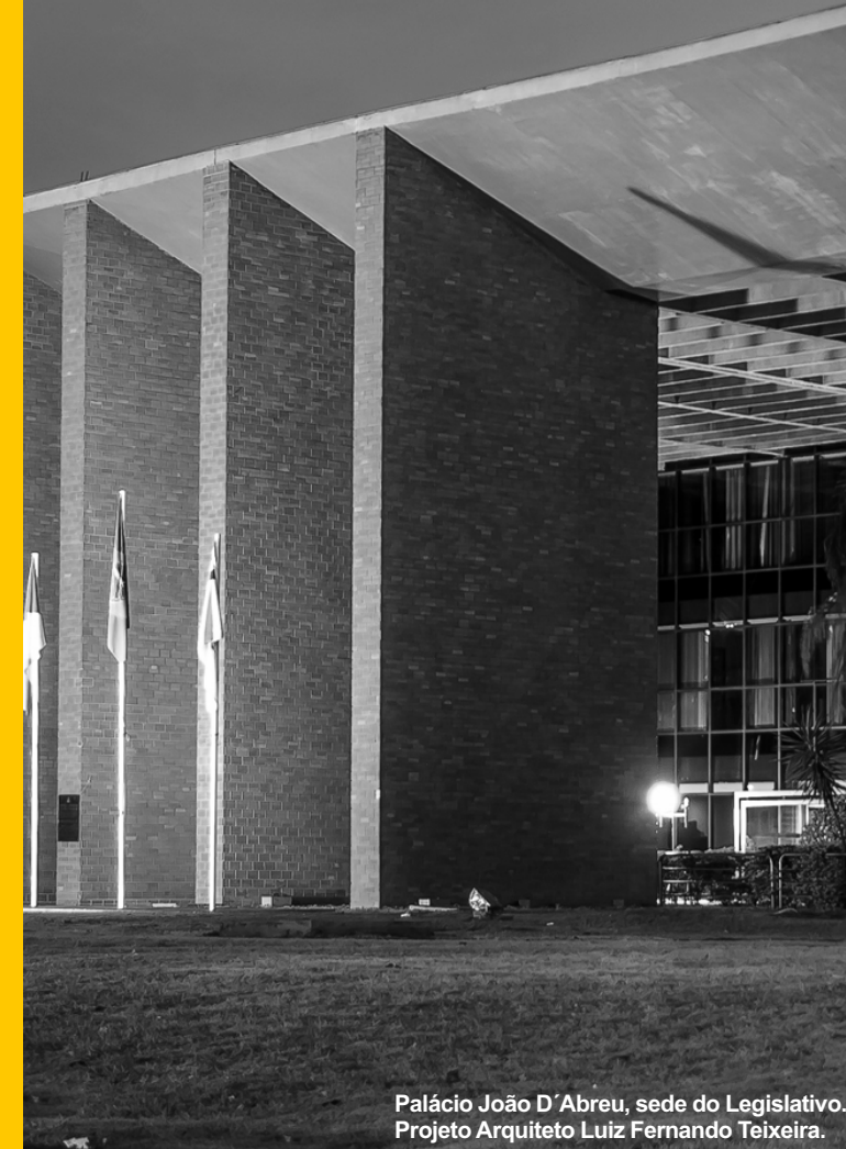
Palácio João D'Abreu, sede do Legislativo. Projeto Arquiteto Luiz Fernando Teixeira.