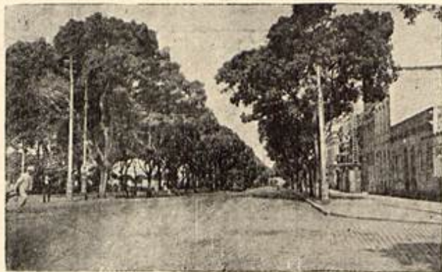
Praça da Republica