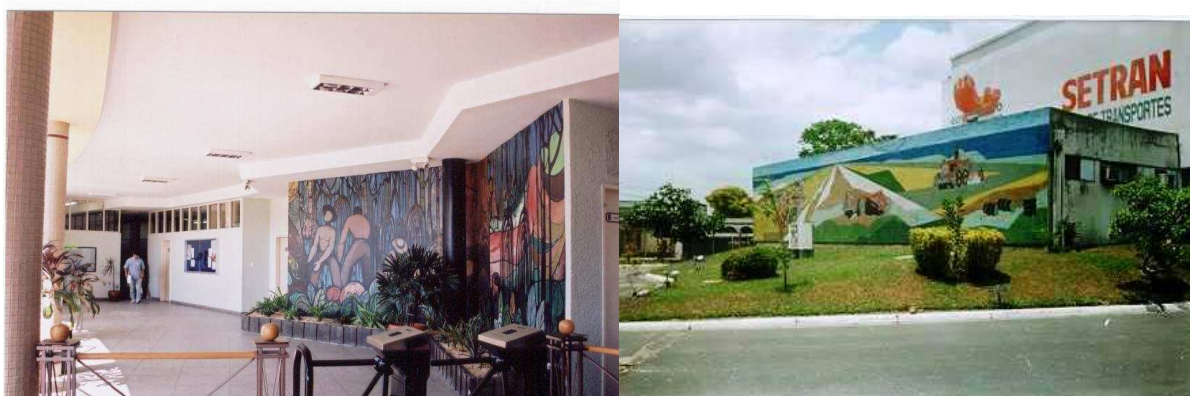
Fig. 2: Sede do DER, projeto Camilo Porto de Oliveira (1956)