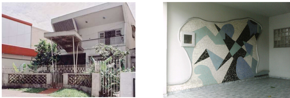
Fig.5: Casa Gabbay projeto do engenheiro Laurindo Amorim, mural de autor desconhecido (1954)

Outras obras desse período fizeram uso desse recurso para aproximar arte e arquitetura em Belém, nos últimos anos da década de 50 até o início da década de 1970, principalmente na incorporação dos murais de azulejos como o da Casa Gabbay (Fig. 5).