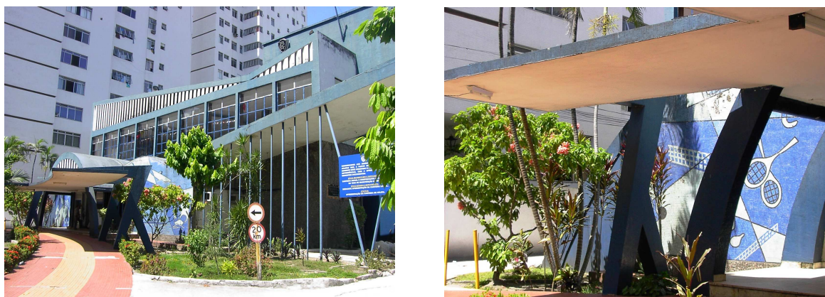
Fig.3: Clube do Remo (1958) projeto de reforma de Camilo Porto de Oliveira