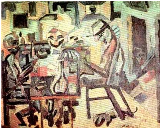
Fig. 1: Ruy Meira “Jogo de Cartas” (1953)

artistas como Ruy Meira e seu sobrinho, posteriormente arquiteto e engenheiro Alcyr Meira, será relevante para a aproximação entre arte e arquitetura a partir dos anos 60.